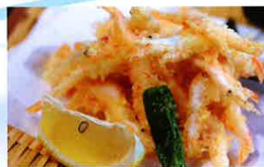
白エビのから揚げ