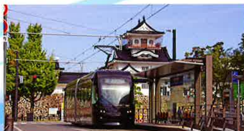
富山市内を走る路面電車