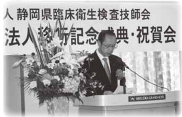
祝辞 宮島日臨技会長