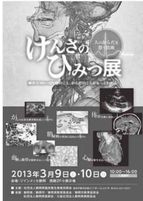
けんさのひみつ展 ポスター