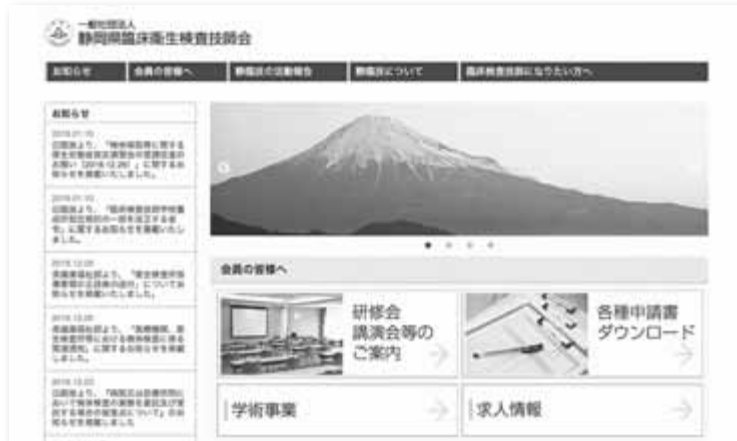
リニューアルされたHP画面