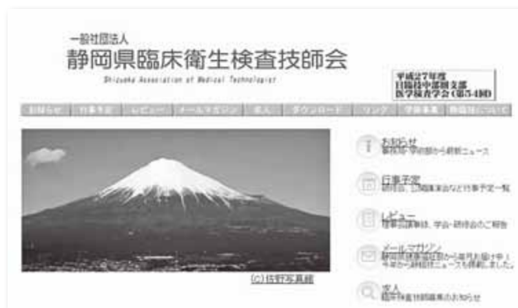
リニューアルされたHP画面